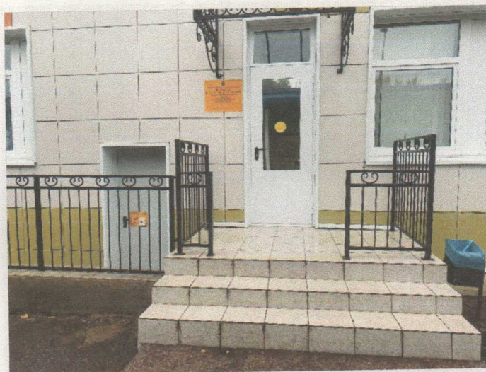
Фото 3. Лестница (наружная)