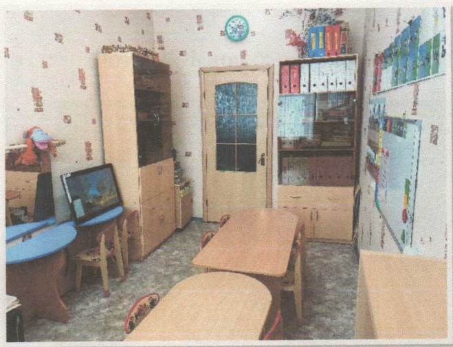
Фото 14.2 Кабинет специалиста