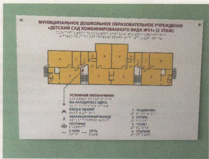
Фото 17.1 и 17.2 Визуальные и тактильные средства (Мнемотаблицы)