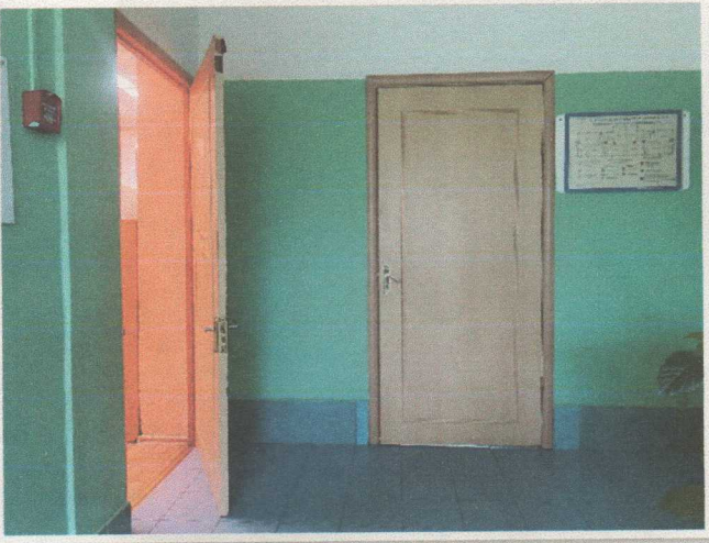
Фото 12. Двери внутри здания