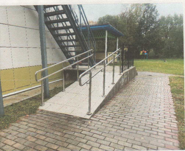
Фото 4. Пандус