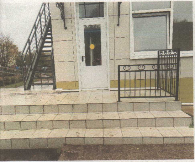
Фото 6. Вход в здание