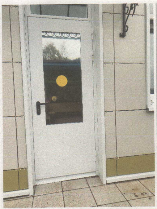
Фото 8. Входная дверь