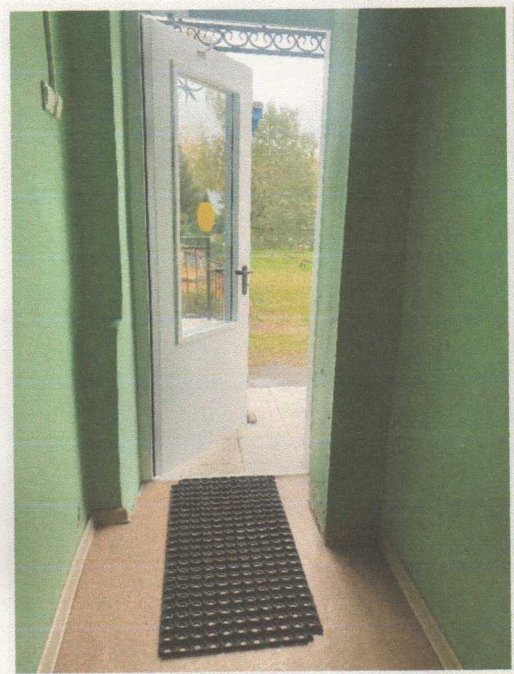
Фото 9. Тамбур