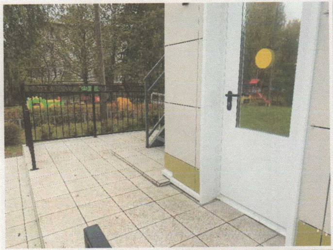
Фото 7. Входная площадка перед входом