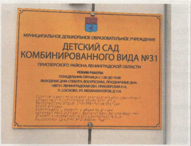
Фото 18. Визуально-тактильная система информации