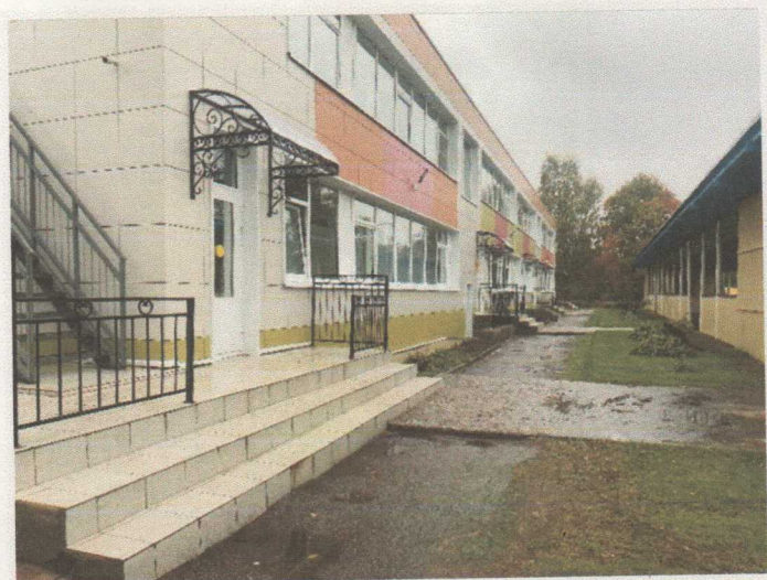
Фото 5. Территория, прилегающая к зданию