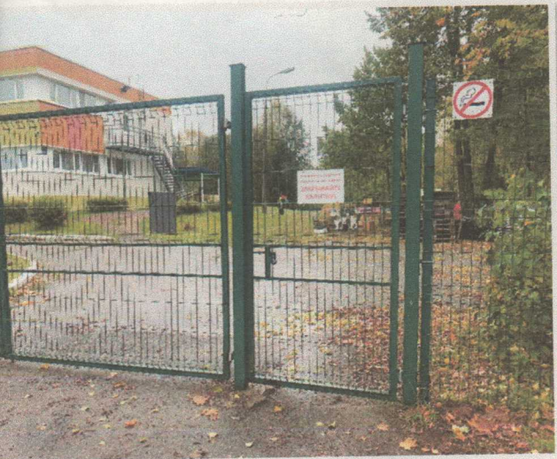
Фото 1. Вход на территорию