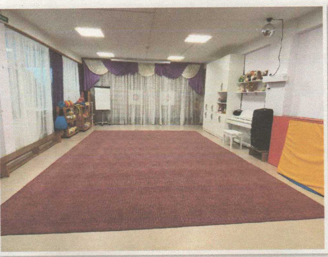
Фото 15. Зал