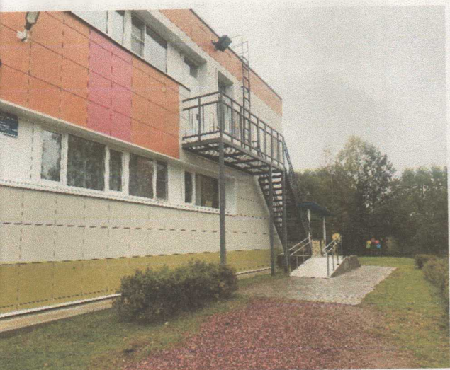
Фото 2.2 Пути движения по территории