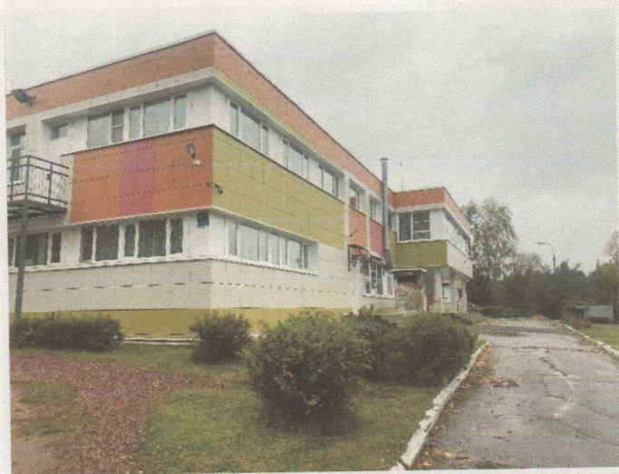
Фото 2.1 Пути движения по территории