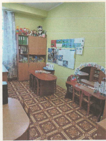
Фото 14.1 Кабинет специалиста