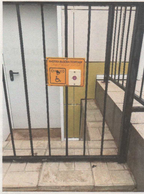
Фото. 17 Кнопка вызова помощи