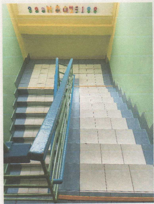
Фото 11. Лестница внутри здания